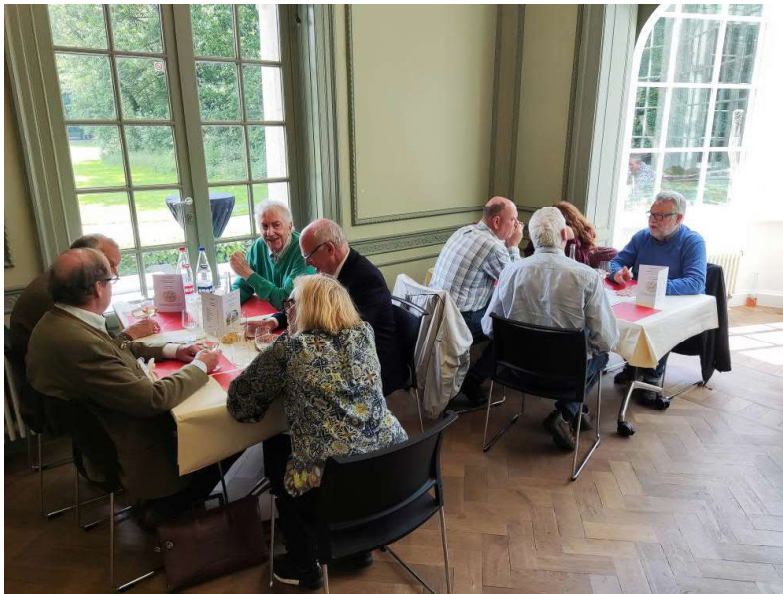
De lunch geserveerd in het kasteel