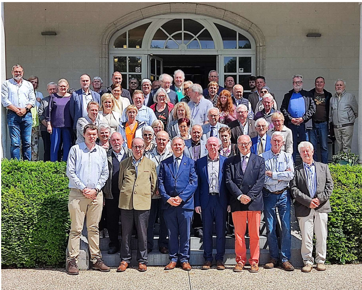
Groepsfoto voor het kasteel Wallemote, uitvergroot