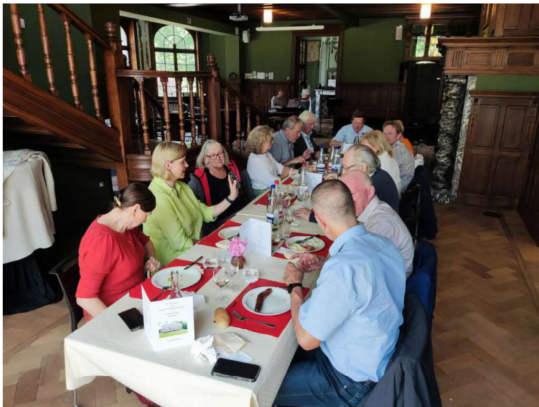
De lunch geserveerd in het kasteel