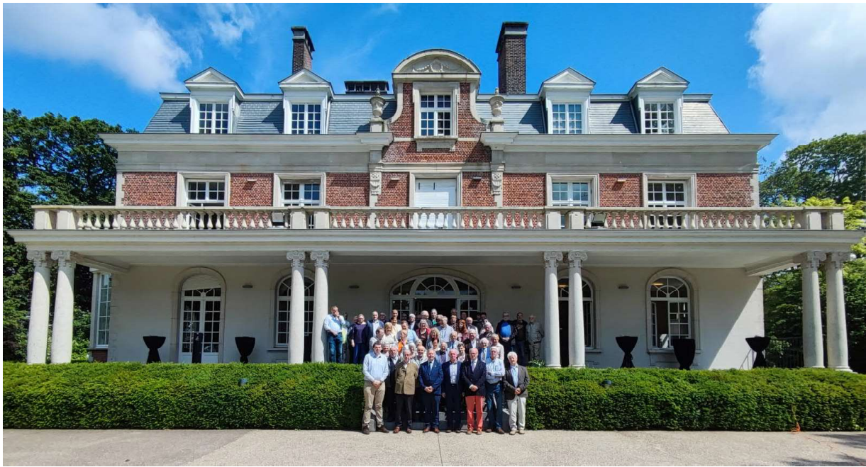
Groepsfoto voor het kasteel Wallemote